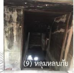
(9) หอสมุดทลบกัย