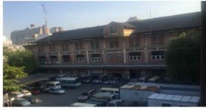
(6) อาคารที่ทำการการพัสดุศสเส (ตึกแดง)