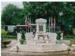
(4) อนุสรณ์ปฐมฤกษ์รถไฟหลวง