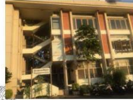
(7) หอสัญญาณกรุงเทพ