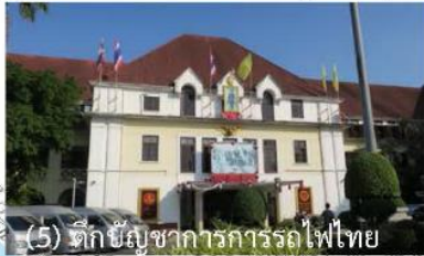
(5) ตึกบัญชาการการรถไฟไทย