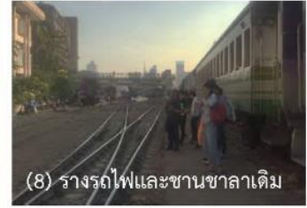
(8) รางรถไฟและชานชาลาเดิม