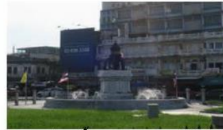
(3) วงเวียนน้ำพุและอนุสาวรีย์ข้างสามเศียร (หอรูทลบกัยทางอากาศและอุทกธารเดิม)