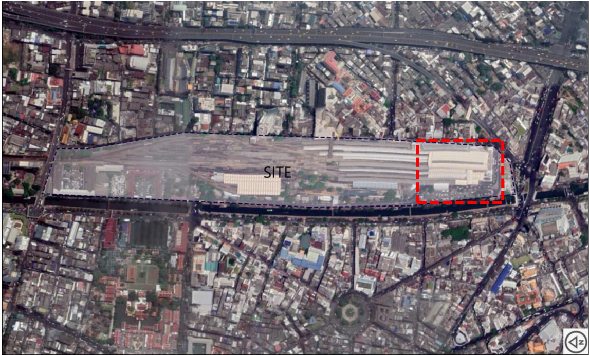
ภาพที่ 1 แสดงขอบเขตบริเวณพื้นที่หัวลำโพง และขอบเขตพื้นที่สำหรับประเภทนักเรียน ในกรอบสี่เหลี่ยมสีแดง เส้นประ