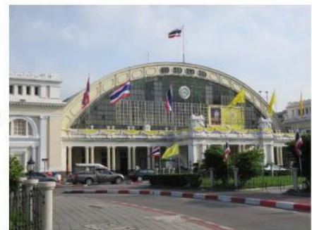
(1) สถานีรถไฟกรุงเทพ (หัวลำโพง)

ภาพที่ 3 แสดงลำดับความสำคัญของอาคารในพื้นที่สถานีรถไฟกรุงเทพ (หัวลำโพง)