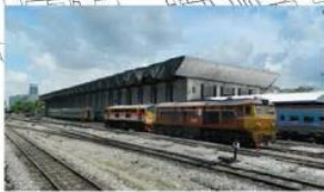
(10) อาคารโรงรถดีเซลรางกรุงเทพ