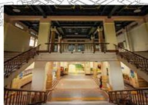
(2) โรงแรมราชธานี (ภายในโถง)